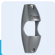
supporto di protezione cover protection ochranný kryt