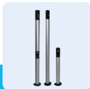
colonnina 1/2 moduli 1/2 module post sloupek na 1 nebo 2 moduly