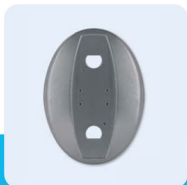
copertura murale finishing cover krytka na zed

Passo, Apro, Vedo: digitální spinač, klíčový spinač a nastavitelná fotobuňka s ochranným krytem a sloupky.